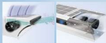
強力ブラシとプラズマクラスターでお部屋をキレイに