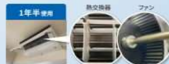
1年半経っても中がこんなにキレイで感動。(30代男性)